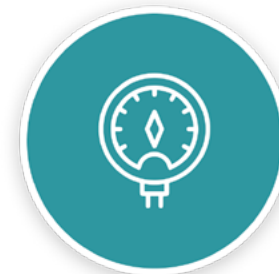
Ossigenazione del Sangue